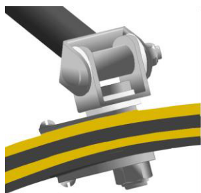
TILLER LOCK BOX