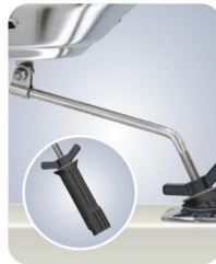
MMA10175 Für zylindrische Angelrutenhalter