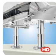
"Dual" Locking Surface Deck Socket Mount MMT10521 Montage auf Deck