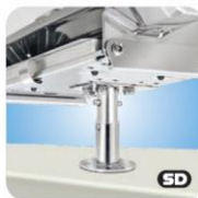
"Single" Locking Surface Deck Socket Mount MMT10321 Montage auf Deck