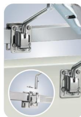
MMA10240 Für Vierkantrelinge/ Schottbefestigung