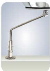
MMA10121 Montage auf Deck, drehbar