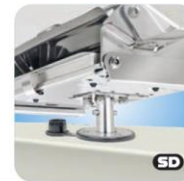
"Single" Locking Flush Deck Socket Mount MMT10326 bündige Deckmontage