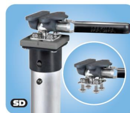
LeveLock® Adjustable All-Angle Accessory for Magma Pedestal Mount MMT10192 Aufsatz für Podesthalterung, jeder Winkel justierbar