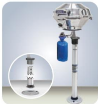
MMA10184 Sockelhalterung 71cm