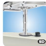
"Single" Locking Height Extension Mount MMT10316 Verlängerung Deckshalter um 15,2cm