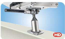
LeveLock® All-Angle Fish-Rod Holder Mount MMT10355 Für zylindrische Angelrutenhalter, jeder Winkel justierbar