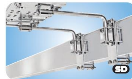
Extended "Dual" Side, Bulkhead or Square/Flat Rail Mount MMT10641 für Vierkantrelinge > 104mm