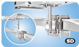
"Single" Side, Bulkhead or Square/Flat Rail Mount MMT10340 Vierkantrelinge / Schottbefestigung