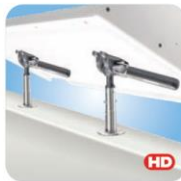
"Dual" Locking Surface Deck Socket with LevelLock® Mount MMT10522 auf Deck Winkel justierbar