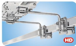
Extended "Dual" Side, Bulkhead or Square/Flat Rail Mount MMT10640 verlängerte Version von MMT10540