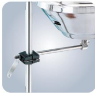
MMA10080 Rohrreling 22,5 / 25,4mm MMA10085 Rohrreling 28,5 / 31,7mm MMA10090 Rohrreling 38mm