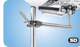
Vertical LevelLock® Round Rail Mount MMT10780 Rohr 22.2 / 25.4mm MMT10785 Rohr 28.6 / 31.7mm MMT10790 Rohr 38.1mm