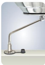
MMA10126 Für bündige Deck- montage, drehbar