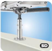
"Single" Locking Surface Deck Socket with LevelLock® Mount MMT10322 auf Deck Winkel justierbar