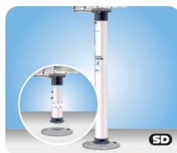
28" (71 cm) Double Locking Stowable Pedestal Mount MMT10185 Podesthalterung 71cm, doppelt arretierbar