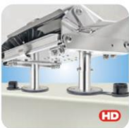
"Dual" Locking Flush Deck Socket Mount MMT10526 bündige Deckmontage