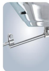
MMA10140 Verlängerung (+ 20cm)