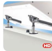
"Dual" Locking Flush Deck Socket with LevelLock® Mount MMT10527 bündig Winkel justierbar