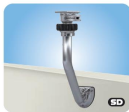
Locking Slide Mount MMT10345 Arretierbare Wandhalterung, Schnellverschluss-System