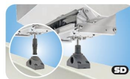
Socket Type Fish-Rod Holder Mounts MMT10365 für Scotty / Striker Grip Angelrutenbeschlag

Diese Preisliste ersetzt alle bisherigen. Preisänderungen ohne Vorankündigung bleiben vorbehalten. Wenn oben nicht anders spezifiziert, gelten die Preise ab Schenefeld & inklusive 19% Mehrwertsteuer.