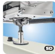
"Single" Locking Flush Deck Socket with LevelLock® Mount MMT10327 bündig Winkel justierbar