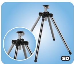
Quad Pod MMT10348 Standhalterung Höhe einstellbar 762 - 965mm