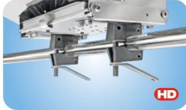
"Dual" Horizontal Round Rail Mount MMT10580 Rohr 22.2 / 25.4mm MMT10585 Rohr 28.6 / 31.7mm MMT10590 Rohr 38.1mm