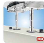
"Dual" Locking Height Extension Mount MMT10513 Verlängerung Deckshalter um 15,2cm