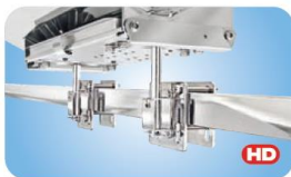
"Dual" Side, Bulkhead or Square/Flat Rail Mount MMT10540 Vierkantrelinge / Schottbefestigung