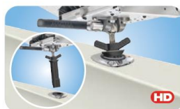
"Pow'rGrip" LeveLock® Double Locking Fish Rod Holder Mount MMT10375 für zylindrische Angelrutenhalter von 37-50mm, jeder Winkel justierbar