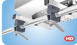
"Dual" Extended Horizontal Round Rail Mount MMT10680 Rohr 22.2 / 25.4mm MMT10685 Rohr 28.6 / 31.7mm MMT10690 Rohr 38.1mm