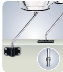
MMA10160 für Tempress Angelrutenhalter