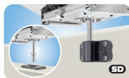
Socket Type Fish-Rod Holder Mounts MMT10360 für Tempress Fish-On & Roberts Angelrutenbeschlag