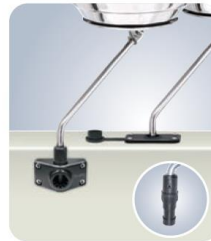
MMA10165 für Scotty / Striker Grip Angelrutenhalter