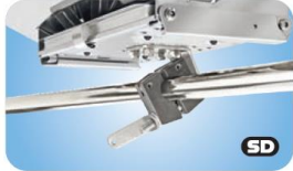
"Single" Horizontal Round Rail Mount MMT10380 Rohr 22.2 / 25.4mm MMT10385 Rohr 28.6 / 31.7mm MMT10390 Rohr 38.1mm