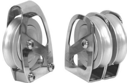
"OVER THE TOP"